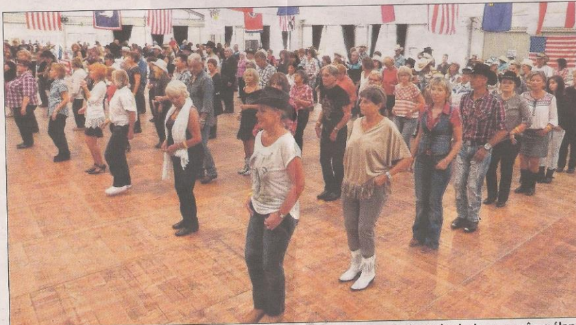
En ligne, en couple ou en club, tous les danseurs hier à Sainte-Maxime étaient réunis dans un même élan.

La fièvre de l'ouest n'a pas fini de se propager!