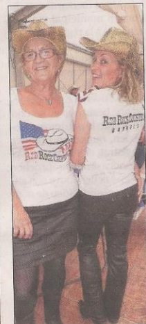
Barjols cow girls.